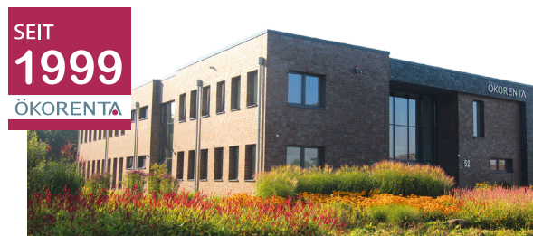
ÖKORENTA-Firmengebäude in Aurich, Ostfriesland

Zum Zeitpunkt der Auflage des Fonds sind weder Vermögensgegenstände erworben, noch stehen konkrete Vermögensgegenstände fest. Sie können sich vor der vertraglichen Bindung an die Fondsgesellschaft insofern kein vollständiges Bild über die Vermögensgegenstände und die damit verbundenen Risiken und Ertragschancen verschaffen. Anleger:innen gehen mit einer Beteiligung eine langfristige Verpflichtung ein - eine Veräußerung an Dritte ist nicht sichergestellt. Für eine vollständige Darstellung der Risiken sollten sie die Risikohinweise im Verkaufsprospekt vom 22. Juli 2022 im Kapitel „Risiken“ lesen. Der Verkaufsprospekt und das Basisinformationsblatt sind kostenlos in elektronischer Form auf unserer Website unter www.oekorenta.de/downloads und in gedruckter Form in deutscher Sprache bei der Auricher Werte GmbH, Kornkamp 52, 26605 Aurich oder bei Ihrem Berater erhältlich.